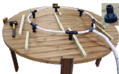
Luftventilerna skruvas fast i botten

Slangen går upp på sidan, 3 cm från kanten, så att vatten inte ska komma in i luftpumpen.