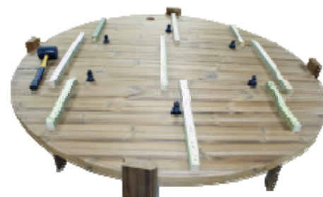
T-styckena trycks och skruvas fast på luftventilerna.